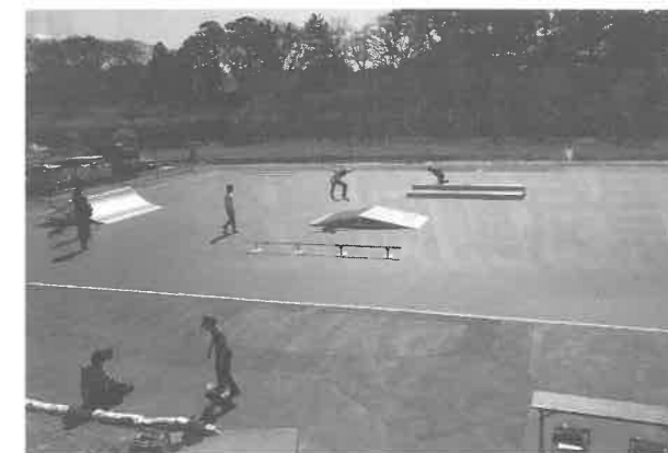
「リリースペイントHG」を塗布した ローラースポーツ場

—— 機能商品とは具体的にどんなものですか 機能商品事業では、防虫分野と景観分野という2つの事業に注力しています。