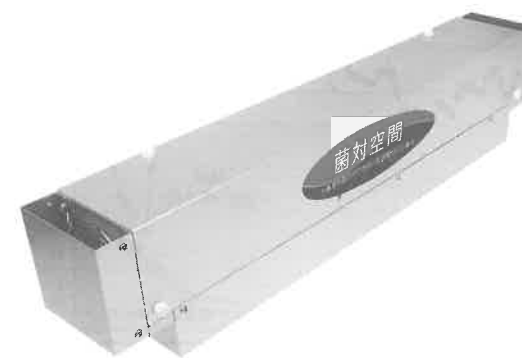
新商品の「菌対空間」

また、景観舗装資材では、「意匠性と機能性のある舗装施工材」の企画・開発・製造・販売を通じて、景観と環境に配慮した街づくりと豊かな暮らしの実現に貢献することを使命と考え、お客様から好評を得ている「リリースペイント」で、全国のアスファルト舗装をこれまでの黒から景観にマッチし、それぞれのコンセプトに合わせたデザインやカラーで彩っていきたくと思っています。そして、当社が注力している「リリースペイント」で、アスファルト舗装用の水性塗料として、お客様からNO.1の評価を頂くことが目標です。