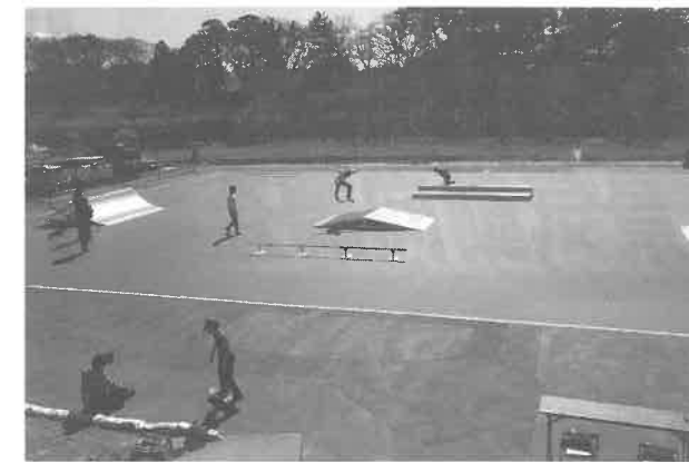
「リリースペイントHG」を塗布した ローラースポーツ場

—— 機能商品とは具体的にどんなものですか 機能商品事業では、防虫分野と景観分野という2つの事業に注力しています。